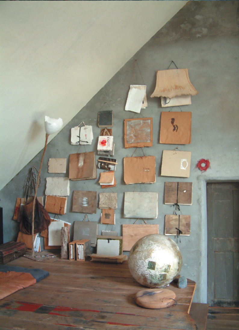
Roos Van de Velde, boven: Serviesset Tafel voor zes , 2013; porselein; alle objecten zijn unica en dus verschillend van formaat. | links onder: Keukenkast, 2012; haagbeuk met originele Japanse schuifdeurtjes; ca. 200 x 200 x 40 cm. | rechts onder: Schetsboeken in atelier, 2007.