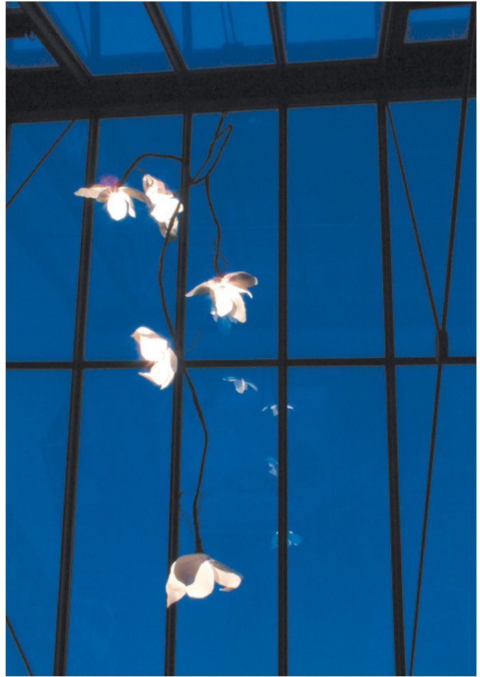
Roos Van de Velde, Magnolia , 2005; verlichtingselement, porselein; lengte ca. 20 cm elk.

spekstenen kachel. Met gebruik van leembouw, met materialen afkomstig uit afbraak van kerken en andere bijzondere panden, regelrecht sloopmateriaal, oude vloerdelen, oude stenen. Van rehabilitatie tot recycling, om maar eens de deftige termen te gebruiken. Ook de meubels zijn zelfgemaakt of zelf hersteld. Grillig gevormde takken, prachtig getekende houten tafelbladen, doorleefde stenen, zelf ontworpen servieskasten, gecombineerd met eigen schilderijen, verlichtingselementen en serviesgoed, roepen een sfeer van een ongewoon soort luxe op. Puur natuur, puur élégance, harmonie en sereniteit.