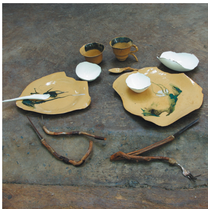
Roos Van de Velde, Thee voor twee , 2012; bruin steengoed en wit porselein; Ø grootste bord 40 cm.